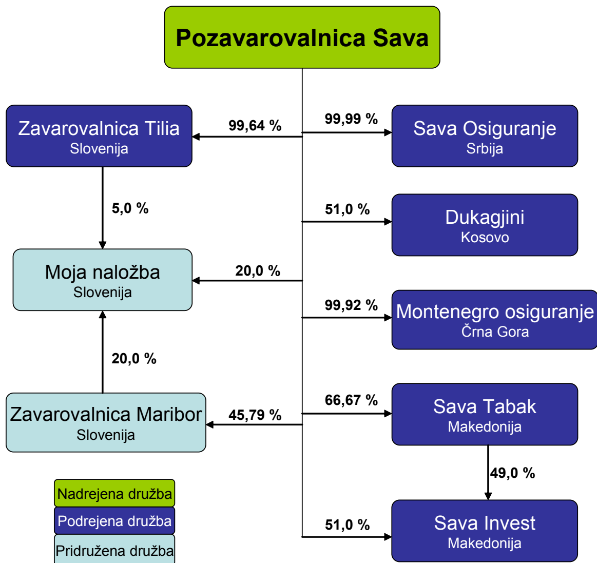
Slika 1: Sestava skupine na dan 30. 6. 2008